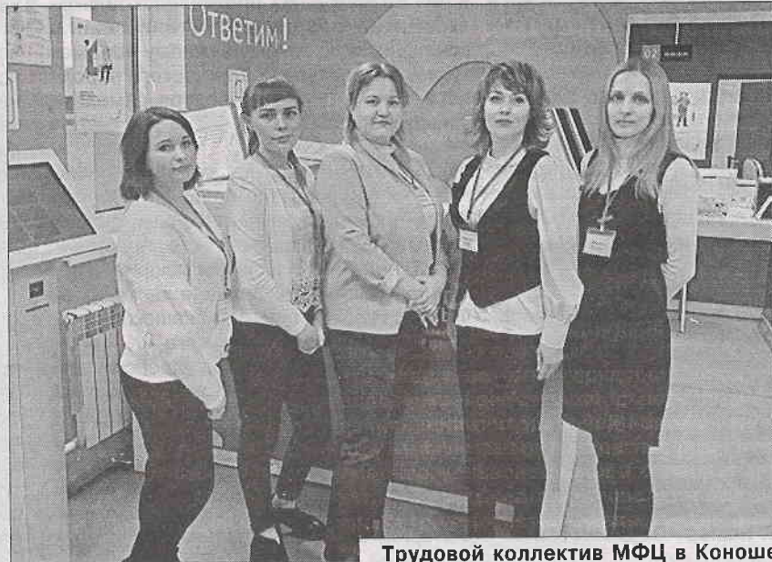
Трудовой коллектив МФЦ в Коноше.